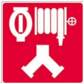
Raccords-pompiers pour le réseau de gicleurs et les cabinets d'incendie