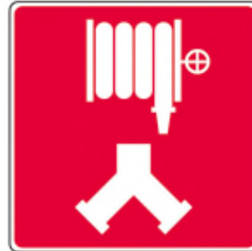
Raccords-pompiers pour les cabinets d'incendie