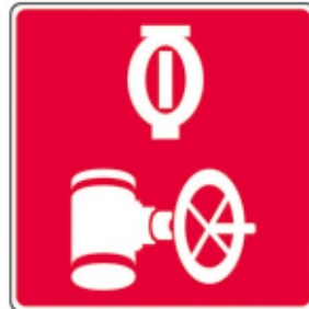
Valve du réseau de gicleurs