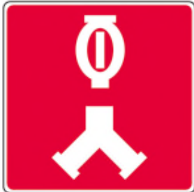
Raccords-pompiers pour le réseau de gicleurs