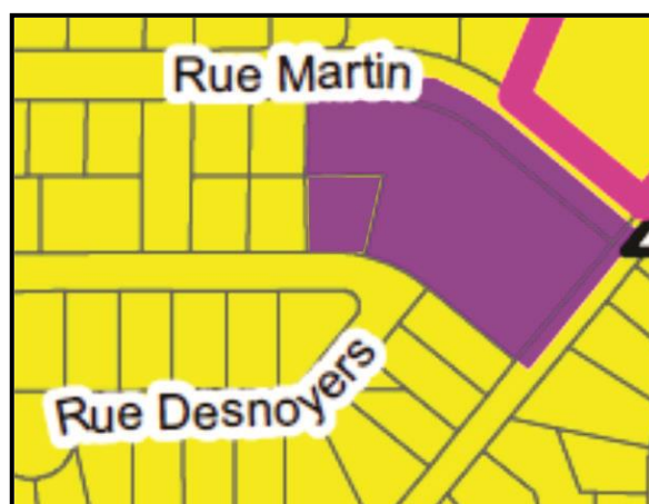
Affectations du sol après modification