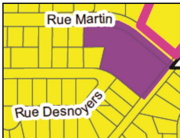
Affectations du sol avant modification