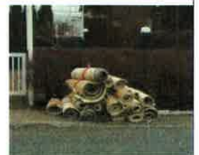
Gros rebuts placés correctement