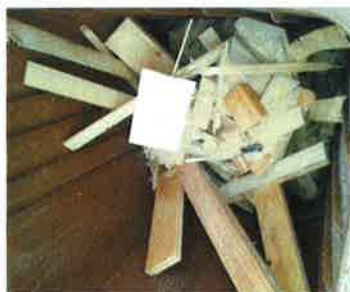
Matériaux de construction