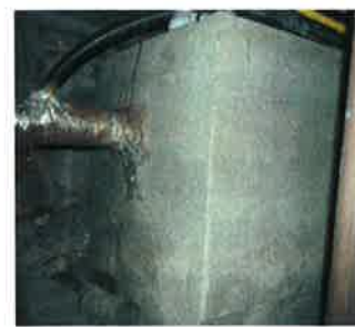
Au sous-sol de la maison