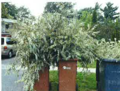
Surplus de branches