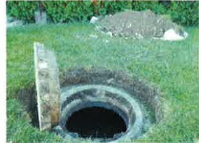
Méthode utilisée pour ouvrir un couvercle