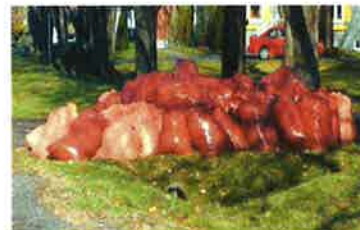
Feuilles dans des sacs de plastique