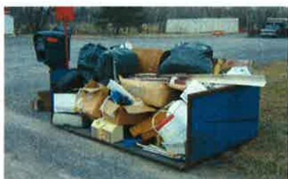
Résidus déposés dans ce qui semble être un spa