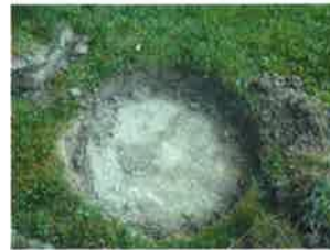
Pas assez déterré