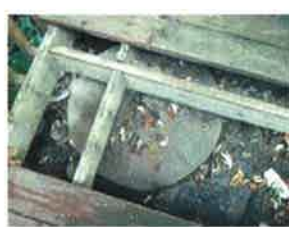
Sous une structure