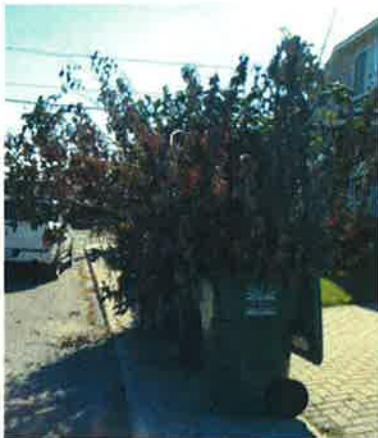
Bac de recyclage et surplus de branches

Ce qu'on retrouve parfois... et qui ne sera pas ramassé