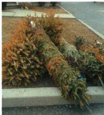
Sapin de Noël