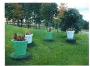
Ornements vissés au couvercle