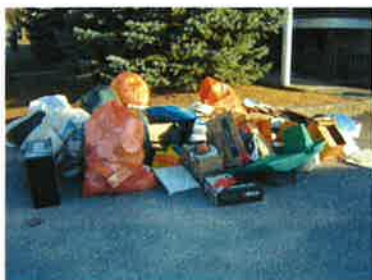
Petits résidus déposés pêle-mêle à la rue